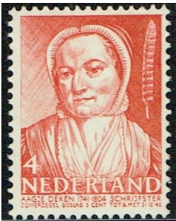
1 Aagje Deken Zomerzegel 1941 NVPH 394

In het eerste artikel uit deze serie over de zomerzegels gaf ik aan dat er weinig vrouwen werden afgebeeld. In deze serie treffen we de bekende Nederlandse schrijfster Aagje Deken aan.