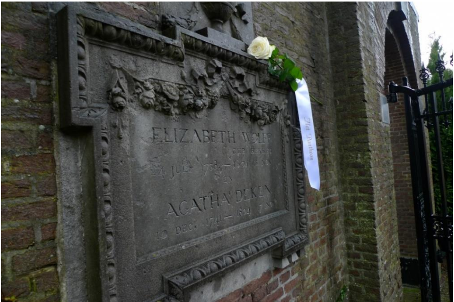
3 Grafsteen Betje Wolff en Aagje Deken op de Scheveningse begraafplaats “Ter Navolging”

Slechts enkele jaren na het stichten van de Bataafse republiek overlijden beide vrouwen. Betje Wolff op 5 november 1804 en negen dagen later volgt Aagje haar in het graf.